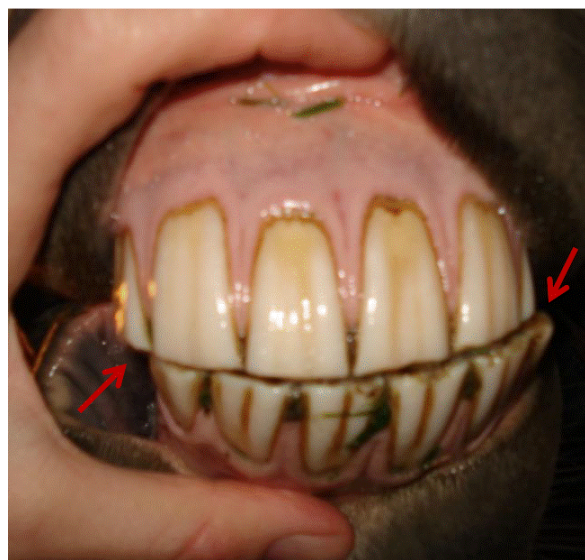
De to foto herover er taget umiddelbart INDEN hesten får Equine Touch.