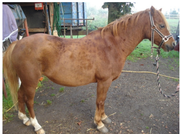
Dette foto er taget EFTER at hesten har fået Equine Touch 4 gange