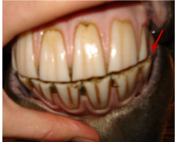
De to foto herover er taget umiddelbart EFTER hesten har fået Equine Touch.