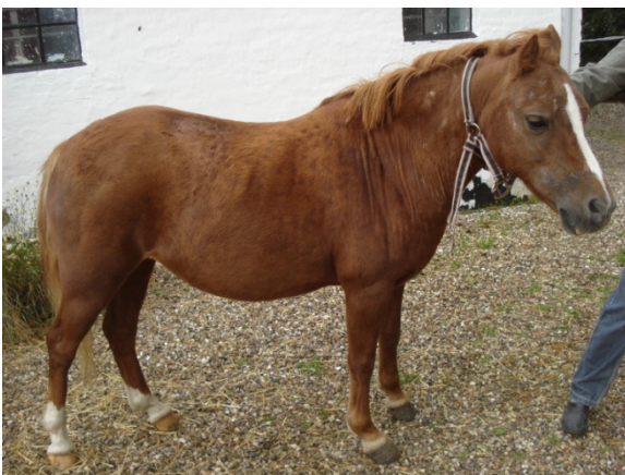
Dette foto er taget INDEN hesten får Equine Touch

Razzel er en 9-årig Sportspony, som led af udslæt på halsen og i hovedet, problemer med vejtrækning samt hoste. Hun havde ingen energi og så virkelig træt ud. Hun havde, over en periode, været behandlet af forskellige dyrlæger flere gange og med adskillige forskellige medikamenter – deriblandt binyrebarkhormon. Hun havde et udbrud i år 2011, som varede fra februar til juni. Det forsvandt, men kom igen i august. Jeg gav Razzel Equine Touch første gang d. 13. september 2011, og her så hun forfærdelig ud med udslæt, mat pels, matte øjne, meget lidt energi, hoste og problemer med vejtrækningen. Efter at have givet hende Equine Touch 3 gange (d. 13., 17. og 21. september), vendte jeg d. 26. september tilbage til en meget forandret pony. Hun havde nu skinnende pels, skinnende øjne, en smule hoste, men bedre vejtrækning og meget mere energi, samt næsten intet udslæt – og hun havde i denne periode ikke fået noget medicin.